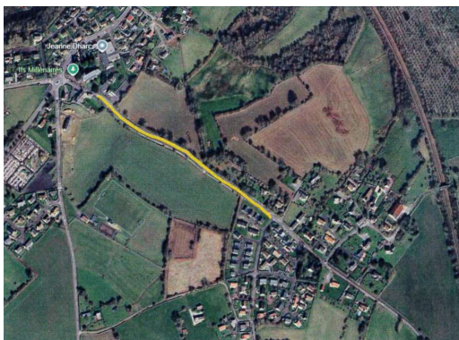
Liaison entre l'« Oisellerie » et l'église